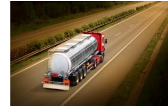
Poids lourds et utilitaires