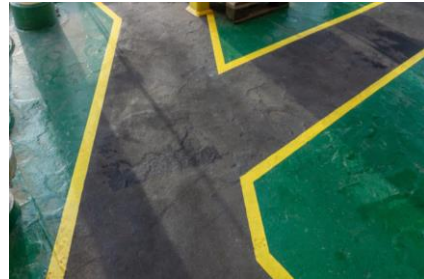
Circulation zone de production